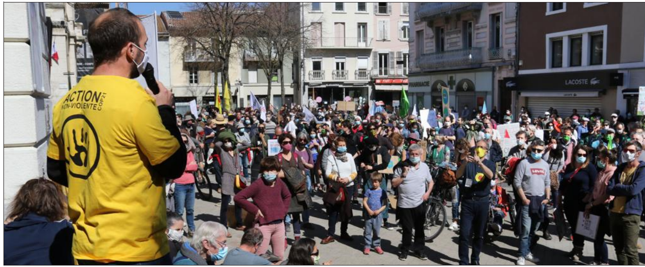
A.F. Une marche pour le climat a réuni plus de 600 personnes, place de la Liberté. Photo Le DL/

Une marche était organisée à Valence dimanche 28 mars après-midi. Elle a réuni plus de 600 de manifestants, qui avaient répondu à l'appel de l'ANV-Cop 21 Valence. Des militants écologistes d'Alternatiba ou de Nous voulons des coquelicots étaient présents ainsi que de simples citoyens de tous âges. Tous réclamaient une vraie transition écologique et exigeaient « une loi climat ambitieuse ». Ils défendent, notamment, les mesures proposées par les 150 membres de la Convention Citoyenne pour le Climat alors que le projet de loi doit être débattu dès ce lundi à l'Assemblée nationale.