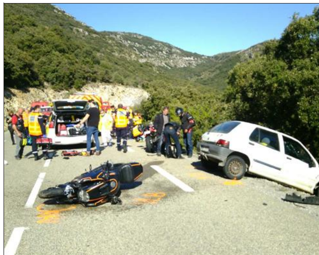
La voiture a coupé la route à un groupe de 20 motards dimanche 28 mars en début d'après-midi sur la RD4 entre Saint-Remèze et la grotte Chauvet 2.

Une enquête a été ouverte par la gendarmerie pour établir les responsabilités. Selon les premiers éléments, il semblerait que l'automobiliste, un jeune conducteur qui roulait à une vitesse excessive, ait coupé un virage, entraînant la succession de chocs avec les deux-roues. Il a été placé en garde à vue par les