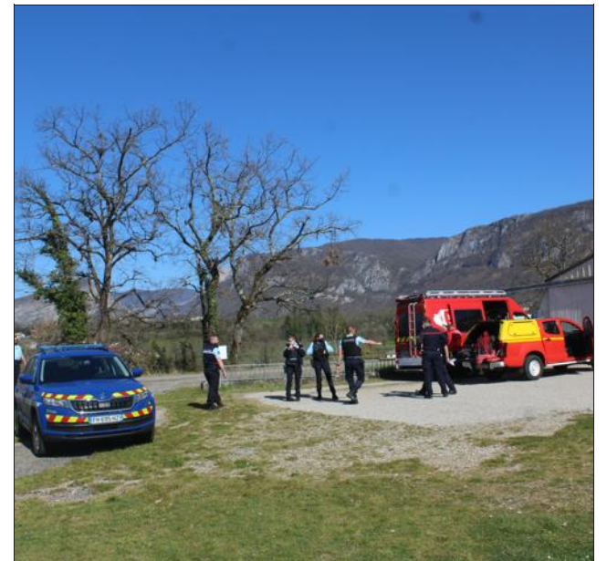
Gendarmes et sapeurs-pompiers ont mis en place un dispositif de recherches.

L'alerte a été donnée vers 15 heures dimanche 28 mars : un témoin a alerté les sapeurs-pompiers de l'Isère alors qu'il venait d'entendre un petit avion semblant en perdition, sur le secteur de Saint-Jean-en-Royans/Saint-Laurent-en-Royans. Objet de l'inquiétude : le bruit très suspect du moteur. Un témoignage pris au sérieux par les autorités, puisque le plan Sater (Sauvetage aéro-terrestre) a été déclenché par la préfecture de la Drôme. Un plan de secours